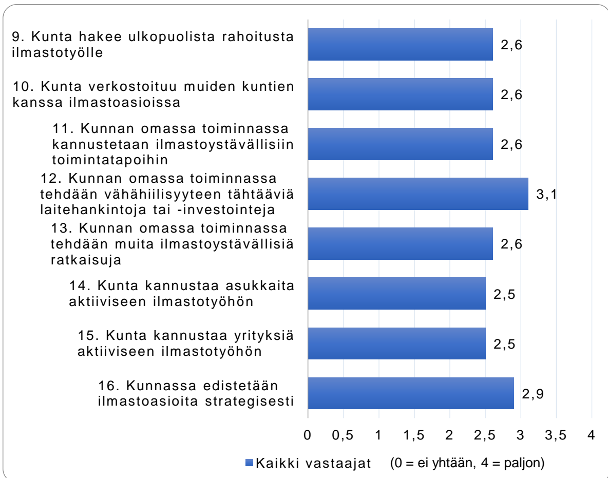
Kuva 2. Kuntien vastaukset kysymyksen ”Kuinka paljon tällaista toimintaa suunnitellaan otettavan käyttöön lähitulevaisuudessa” väittämiin.

Kuntien vastausten kokonaiskeskiarvot kysymyksen väittämiin ”Kuinka paljon seuraavia asioita on toteutettu kunnassasi tällä hetkellä” oli 1,9 ja kysymyksen väittämiin ”Kuinka paljon tällaista toimintaa suunnitellaan otettavan käyttöön lähitulevaisuudessa” oli 2,7 (Kuva 3).