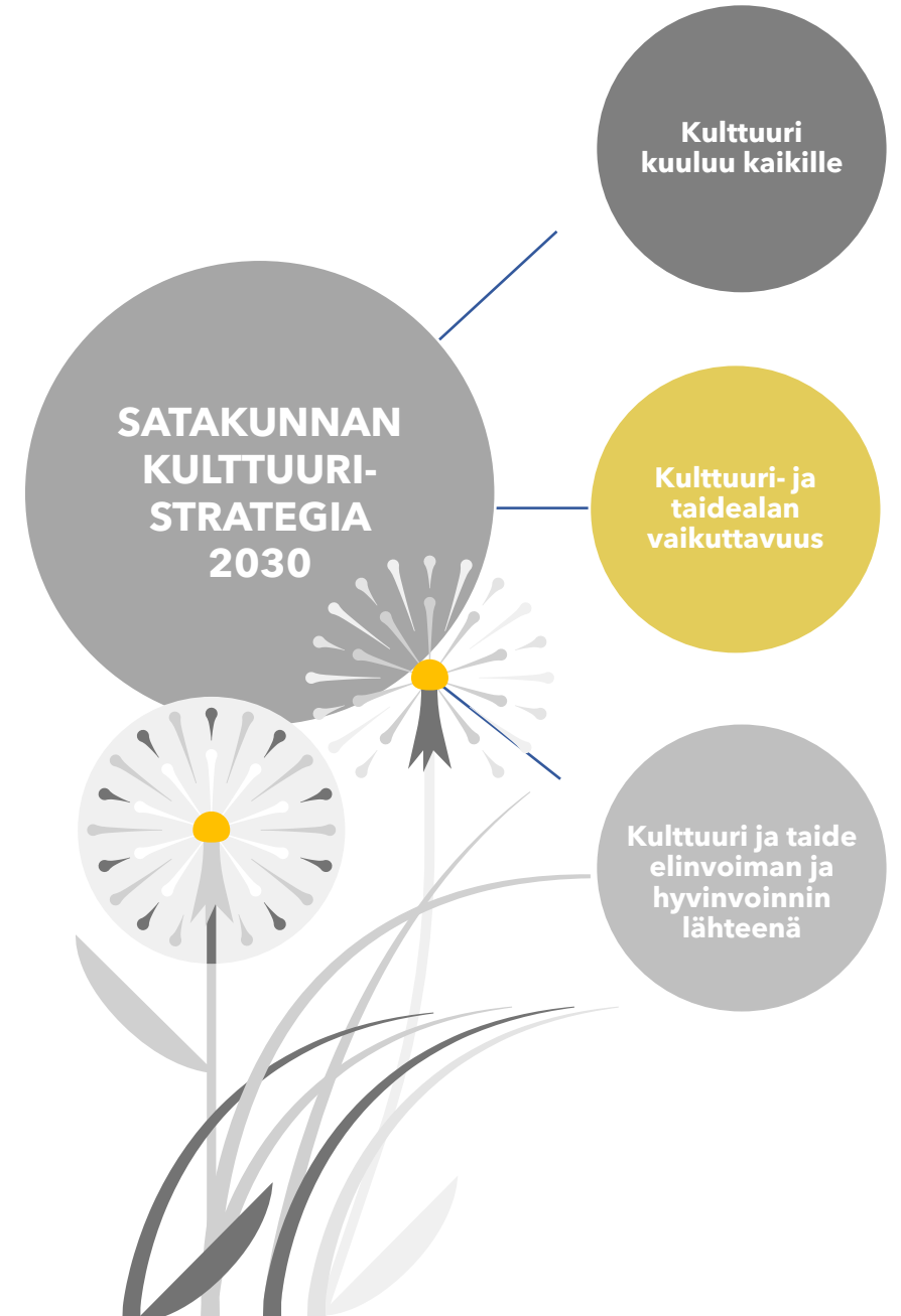
Kuva 1. Satakunnan kulttuuristrategian 2030 tavoite- ja teemakokonaisuudet

Kokonaisuuksissa on paljon yhtäläisyyksiä aikaisempaan strategiaan, mutta päivityksen yhteydessä on pyritty rohkeasti katsomaan eteenpäin ja nostamaan esille uusia avauksia.