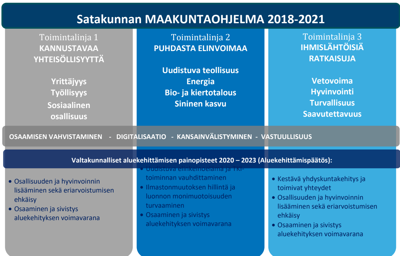
Kuva 2. Satakunnan aluekehittämisen strategiset linjaukset (Maakuntaohjelma 2018-2021) ja valtakunnalliset aluekehittämisen painopisteet (2020-2023)

Lisäksi nostetaan esille muutostekijöitä, joiden nähdään olevan merkityksellisiä Satakunnan aluekehittämisessä tulevana vuosina tehtävissä linjauksissa (esim. maakuntaohjelma 2022-2025). Katsauksessa on lisäksi tuotu esille Satakunnan nykytilannetta kuvaavia tilastotarkasteluja.